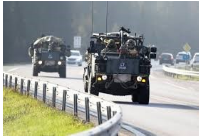
Nederländska militärfordon på svensk väg, exempel på nyttjande av logistiknätverket.

Försvarsberedningen konstaterar vidare att Försvarmakten har tagit viktiga steg mot ett sammanhållet logistikkoncept men att fortsatt utveckling krävs för att tillgodose behoven som allierad inom Nato. Regeringen delar denna bedömning och konstaterar att Försvarmakten bl.a. arbetar med att inrätta ett logistiknätverk för nationella och allierade behov.