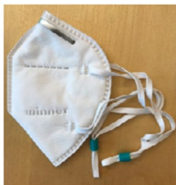
Figure 1. Package with masks as delivered to FOI (left). One mask (right)