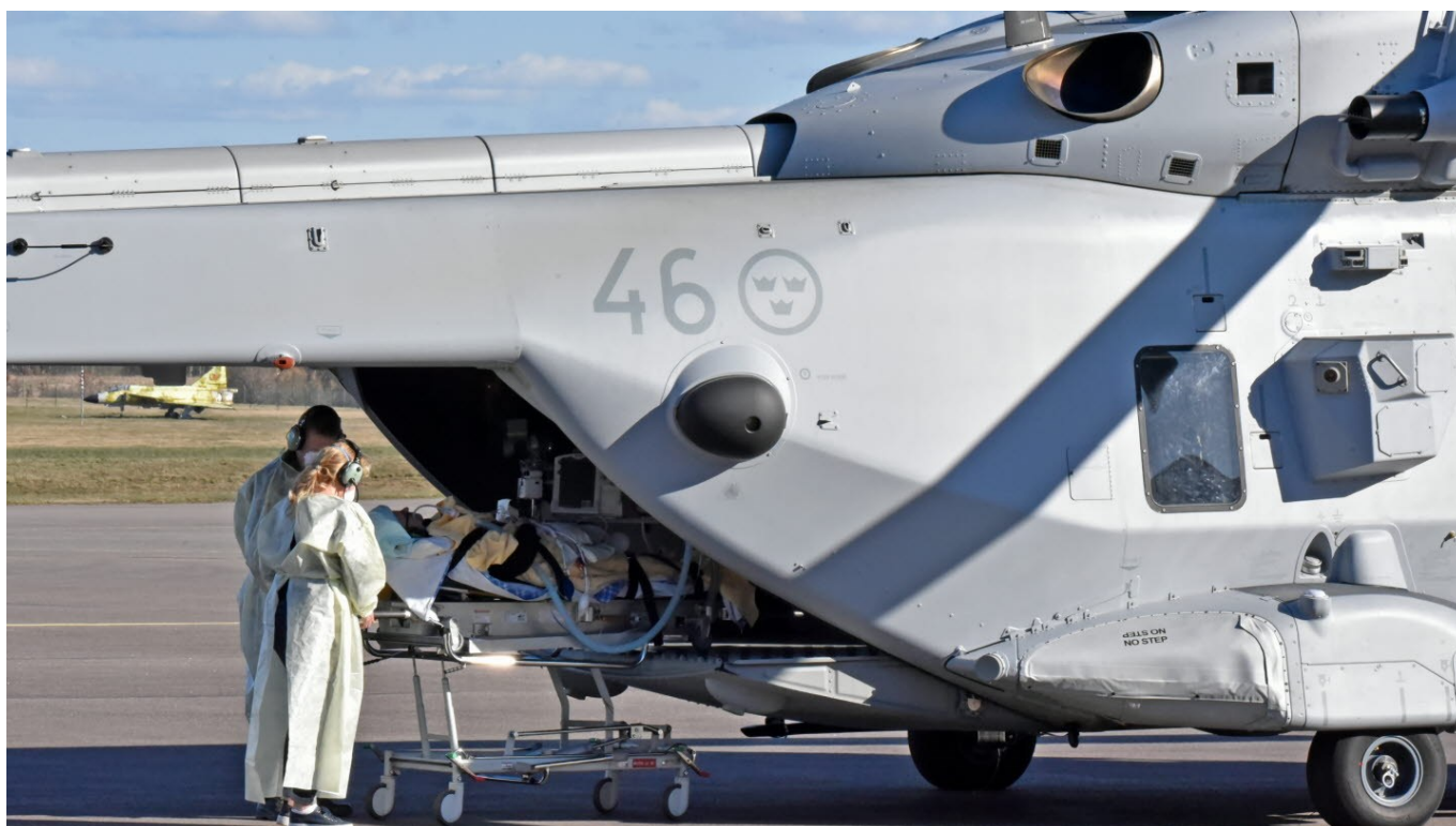
Helikoptrar har utrustats med civil utrustning för intensivvård och är tillgängliga för transport av patienter över hela landet.

Coronapandemin har på nytt tagit ett stadigt grepp om det svenska samhället. I skrivande stund fortsätter smittspridningen att öka och visar inga tecken på att avmattas. Beslutade nationella och regionala restriktioner innebär att planerad verksamhet måste ställas in eller skjutas på framtiden. Det gäller alla och påverkar givetvis också Försvarslogistikklubben. Detaljer om hur det berör planerade