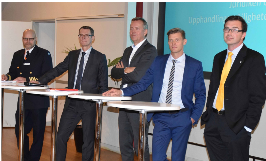
Panelen under avslutande frågestund

Klubben tackar också deltagarna i seminariet för god uppslutning på vår inbjudan. Utan deltagare inget seminarium! Inför nästa år hoppas klubben att ni kommer ha samma intresse för 2019 års seminarium.