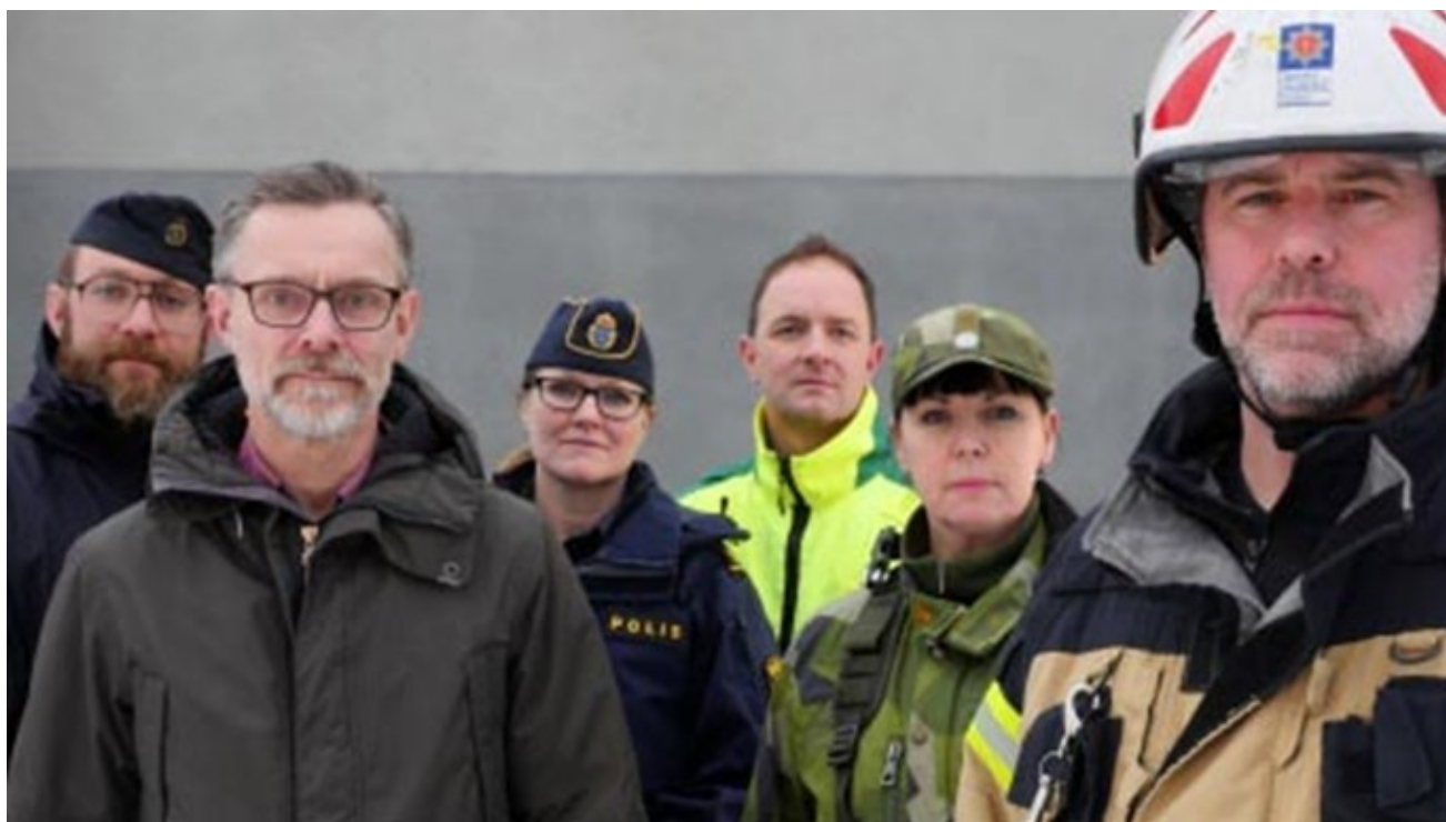
Försvarsmakten och MSB planerar en nationell totalförsvarsövning under 2020.

Ett utförligt referat från seminariet redovisas i detta nummer av Försvarslogistiknytt. Dessutom en aktuell beskrivning av transportledningens verksamhet inför och under den stora NATO-övningen TRIDENT JUNCTURE som genomfördes i Norge med svenskt deltagande men där stora delar av tilltransporterna gjordes genom Sverige. Trevlig läsning.