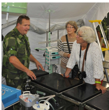
Förevisning av fältsjukhusmateriel

Nåväl, i Göteborg, ute på Kärringberget där förut KA 4 sedermera Amf 4 var förlagt, ligger sedan ett antal år Försvarsmedicincentrum (FömedC) som i rakt nedstigande led härstammar från MedfackS på Frösunda. Så vad kunde inte bli en bättre start på en trängträff än att göra ett besök på FömedC för att