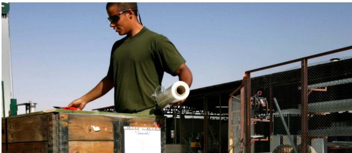
Förrådsman i arbete med RFID-tagat gods

Passiv RFID, Radio Frequency Identification, är en teknik som innebär att en tagg med antenn sys in i till exempel uniformspersedelar eller klistras på materiel så som dataskärmar. Taggen behöver inte vara synlig. En stor mängd materiel kan sedan läsas av samtidigt genom en handdator eller en större läsrigg. Prov och försök med passiv RFID-teknik har skett vid Servicecentrum i Revingehed. Passiv RFID används redan idag inom Försvarens stor utsträckning men i andra tillämpningar, som exempelvis passersystem och inloggningssystem.