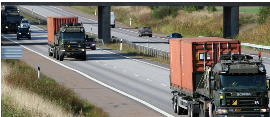
Logistikförband under landsvägsmarsch