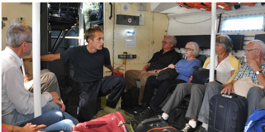
Instruktion inför båtfärd med stridsbåt 90

Den 6-7 september var det dags för kamratföreningarna vid f.d T1, T3 och T4 och högst levande Trängregementet (T2) samt Trängklubben att samlas för den årliga trängträffen. Arrangör för trängträffen den här gången var Trängklubben som ju har sin huvudsakliga förankring i Stockholm. Redan för drygt ett år sedan, då Trängklubben antog utmaningen att arrangera 2013 års trängträff, var huvudinriktningen att genomföra evenemanget i Göteborg.