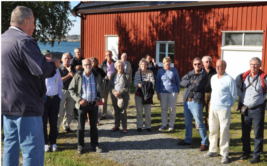
Guidning på Käsö

På tal om Hallandsklass så minns säkert en och annan skrönan om armé-kadetten på Karlberg som vid Operation Samverkan kommer ifrån sin grupp på Berga örlogsbas och går fram till den galonerade personen med fyra breda streck på axelklaffarna och frågar: "Kan överfuri- ren säga mig var jagarbåten Allan ligger bunden"? För den oinvigde vad gäller flottans gradbeteckningar så betydde fyra streck på den tiden att vederbörande var kommendörkapten (i dag kommendör).