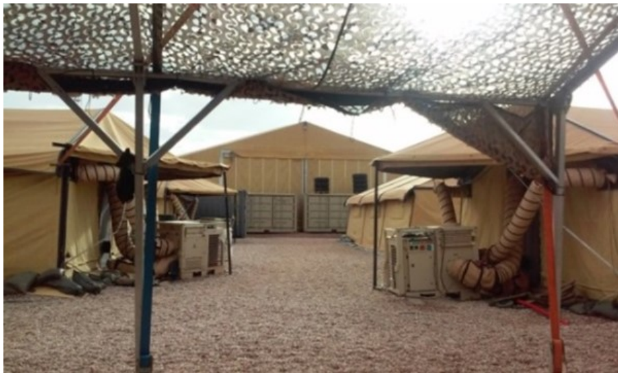
I fonden rep-hallen på Camp Nobel. En F-16 hangar som norska försvaret har modifierat till tälthall för allmänt logistikbruk. I förgrunden ses ett antal arbets- och boendetält med tillhörande kraftiga luftkonditioneringsanläggningar, s.k. Sopranos efter företagsnamnet.

När camperna stod färdiga våren 2015 skedde en intern projektöverlämning inom FMV varvid etableringsprojektet lämnade