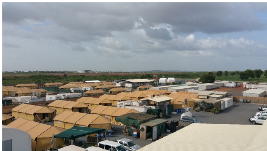
Utsikt över Camp Midgård med Bamakos internationella flygplats i bakgrunden. Campen delas med Nederländernas stödfunktion för eget förband grupperat i Gao i östra Mali.

MINUSMA är den första FN-missionen med uttalat miljöfokus. Detta har Försvarsmakten och FMV tagit fasta på, bland annat genom ett frekvent systemstöd från myndigheternas miljösamordnare. Sopor hämtas av FN medan farligt avfall transporteras till Sverige i den mån det inte