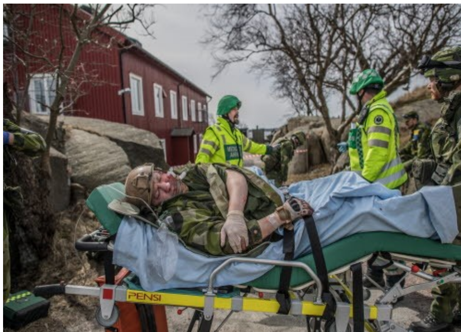
”Skadad” soldat tas omhand av civil ambulanspersonal under samövning

ska utveckla förmåga för livsuppehållande transportkirurgi. Försvarens helikoptersystem ska utvecklas till att mer flexibelt kunna nyttjas för sjuktransporter. Marinen och Flygvapnet ska utveckla den medicinska förmågan på taktisk nivå anpassad till modernt krig.