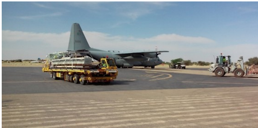
En av flera svenska luftbroar mellan Bamako och Timbuktu. En del materiel tål inte att transporteras landvägen.

Nobel vintern/våren 2019-20. Mali 12 blir, som planerna ligger, först ut på den nya lokaliseringen i Mali, samtidigt som förbandets NSE, grupperat i Bamako, följer upp resterande avtransporter av svensk och norsk materiel från Timbuktu och Mali.