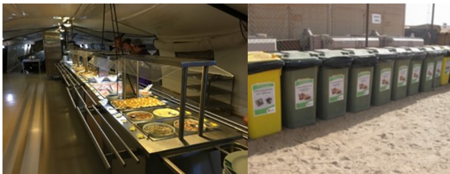
Mat serveras och sopor sorteras. Allt i god ordning.

FMV bygger soltak över elverksplattan på Camp Nobel. Entreprenören CADG har även byggt stora delar av FNs s.k. supercamper i Mali. Företaget startades av en amerikansk medborgare som arbetade i Afghanistan när USA och England anlände dit med trupp och sökte leveranser av infrastruktur och transporter. I takt med internationella styrkereduceringar sökte sig företaget nya marknader och en sådan fann man med FN i Afrika.