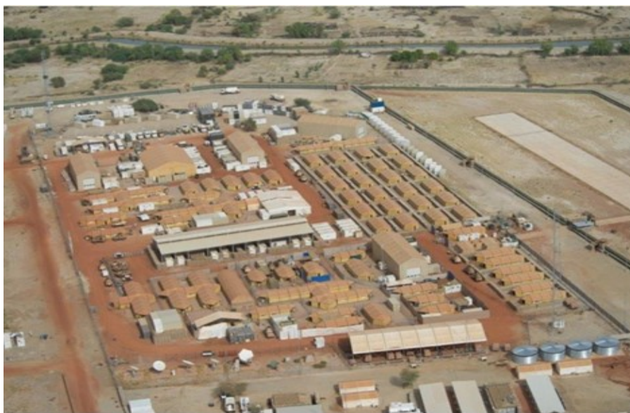
Camp Nobel, Mali.

De offentliga resonemang som bland annat fördes via en paneldebatt under Försvarsmaktsråd Skaraborg gav vid handen att beredningen är ganska överens om att Försvarsmaktens ekonomi behöver stärkas. Det som nämns är 1,5 procent av BNP och det motsvarar ca 90 miljarder kronor från 2025. Detta inne-