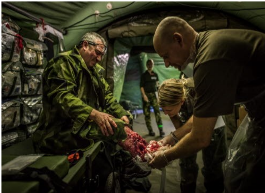
Arbete på förbandsplats.

Från händelserna på Drottninggatan i Stockholm via terrordåden på Srilanka till den ryska annekteringen av Krim och stri-