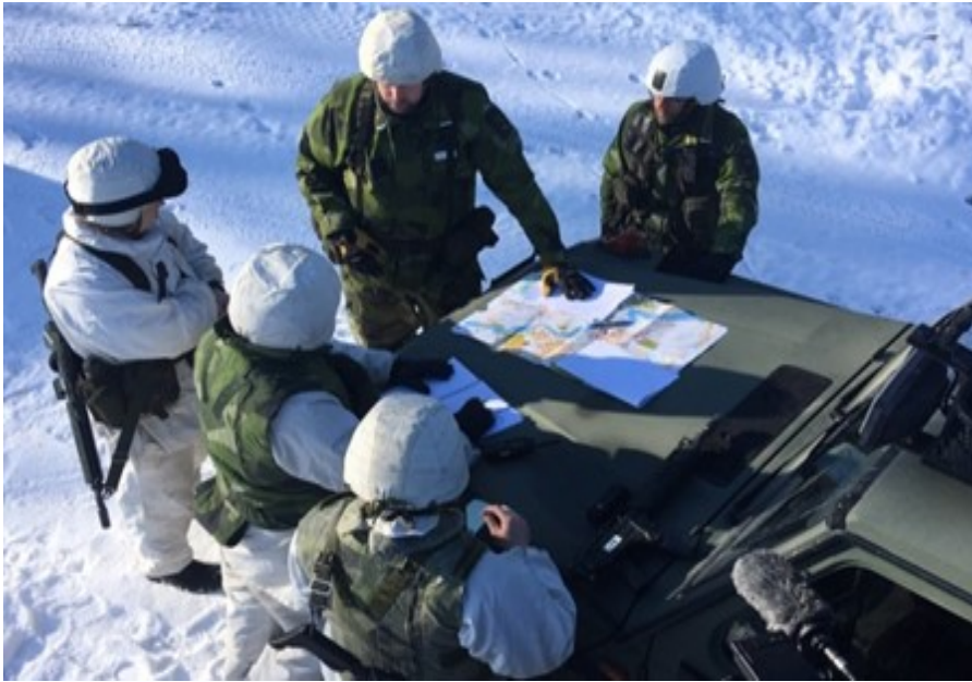
Ordergivning i samband med arméövning Northern Wind 2019 . Källa: Författaren

bär en succesiv ökning av försvarsanslaget från 2021. Försvarsanslaget är 2019 ca 55 miljarder kronor. Detta är en förutsättning för att Försvarsmaktens operativa förmåga ska öka under perioden eftersom Försvarsmakten inte haft tillräcklig ekonomi att modernisera och underhålla befintlig materiel.