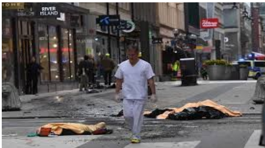
Läkare på Drottninggatan strax efter attentatet.

Hotet från terrorism eller de hot ett gråzonsscenario skulle kunna innebära kräver i princip samma typ av förmåga, men i mindre skala, som krävs för att hantera sjukvård i krig. Delar av det system som utvecklas för framtiden kan nyttjas för att stödja