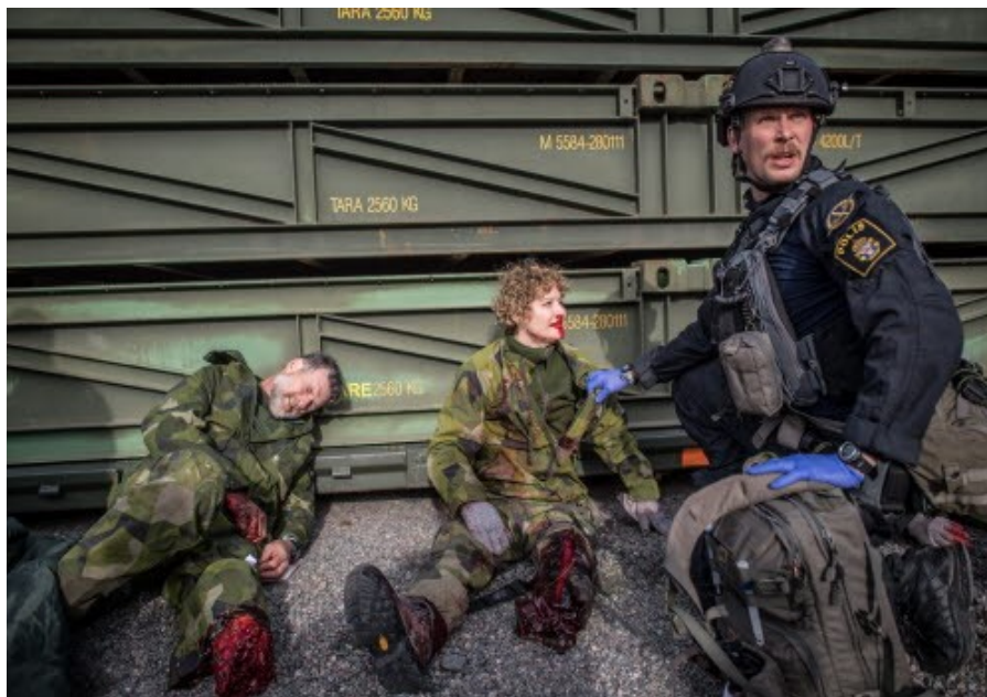
Omhändertagande av skadade under samövning.

Militärregionerna (MR) ska utveckla förmågan att genomföra regional samverkan inom hälso- och sjukvårdssektorn. Sjuktransportresurser och sjukvårdsförstärkningsresurser ska tilldelas varje MR som ska utveckla en förmåga att leda dessa under den