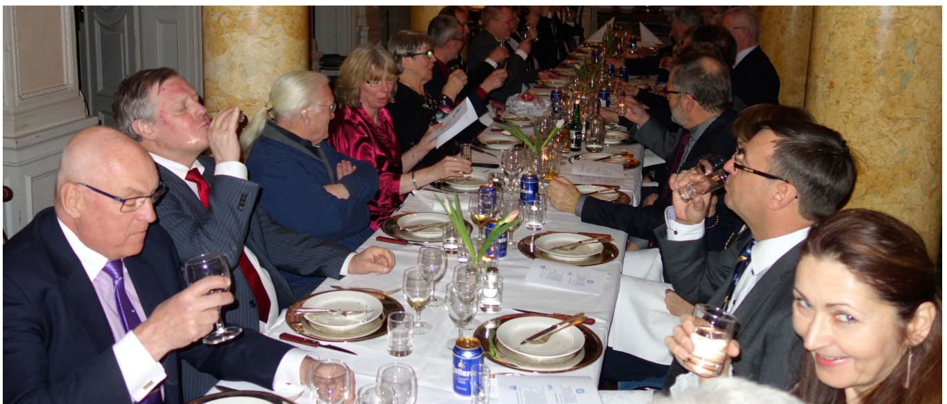
God stämning vid middagsbordet