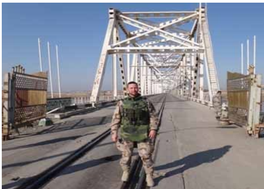
Gränsövergången som förbinder Uzbekistan med Afghanistan vid Hairatan är den i särklass viktigaste ur försörjningsperspektiv. Här börjar också Afghanistans enda järnväg som slutar i Mazar e Sharif. Övlt Fredrik Gustafsson stf CJ4 RCN.