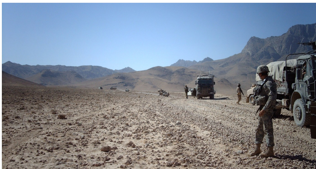
Bilden illustrerar vardagen för soldaterna i Afghanistan med ofta förekommande incidenter längs de livsviktiga underhållsvägarna.